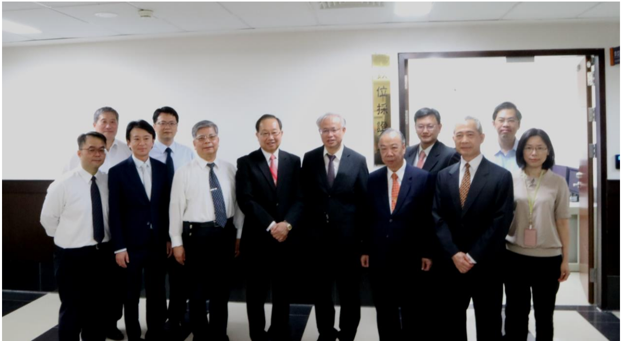
數位採證中心啟用典禮參與人員合影