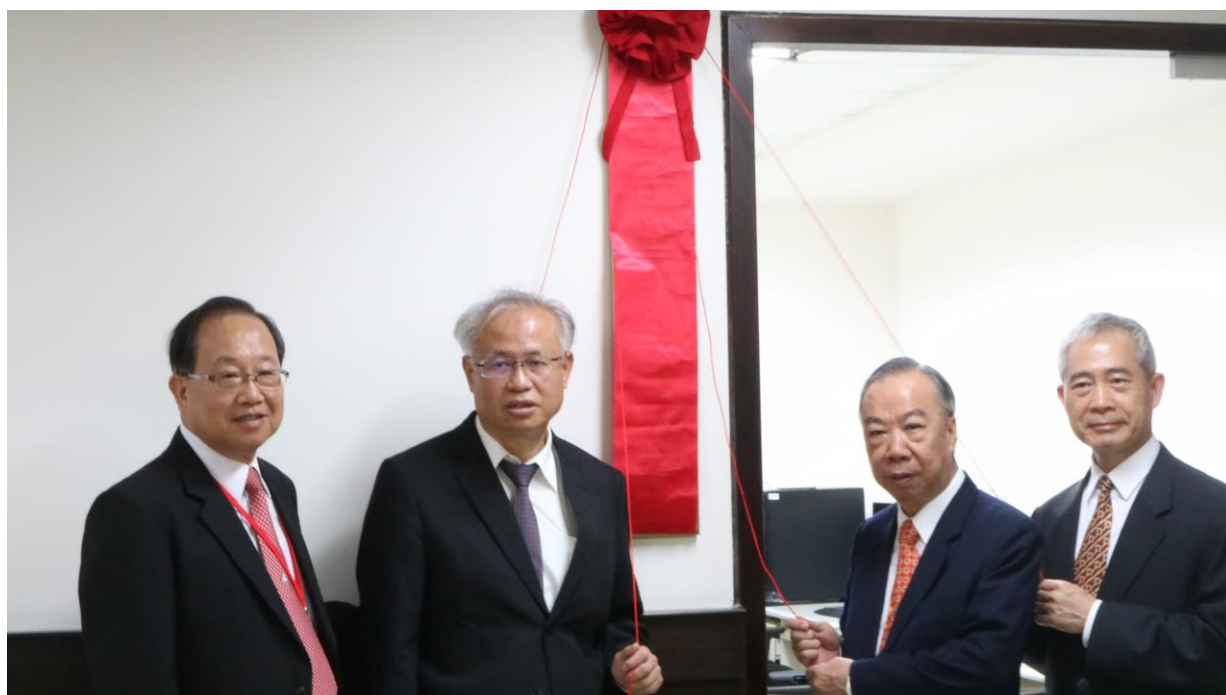
數位採證中心啟用典禮主持人員合影，自左至右分別為：本署檢察長彭坤業、法務部常務次長張斗輝、臺高檢檢察長王添盛、新竹地檢署檢察長姜貴昌

目前本署採證中心編制共有 5 人，由主任檢察官 1 名、檢察官 2 名、檢察事務官 2 名組成，專責人員並取得專業證照(CHFI、NSPA)。未來將持續提昇全體檢察官之解讀數位證物能力，使檢察事務官均具備分析採證資料能力，讓偵查程序更加便利、科學、精確；同時本署亦結合數位採證室及毒品資料庫，讓新興數位資料匯入臺灣高等法院檢察署之全國毒品資料庫，即時擴增、整合通訊資料，供大數據分析比對，深度勾稽毒品運輸、製造、販賣網絡，有效溯源斷根，打擊毒品犯罪，建立安居樂業之無毒家園。