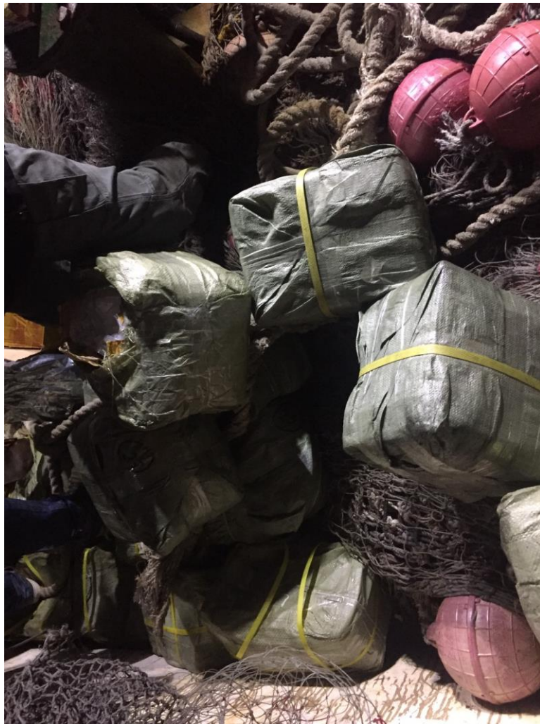
毒品以紙箱、麻袋層層細裝，偽裝成貨物置於漁船船艙

本署將持續貫徹「拔根斷源、阻絕供給」之緝毒工作，結合檢察、軍憲、警察、調查、海巡、關務等六大緝毒體系，廣泛蒐集轄區內外所有毒品源頭、國際毒盤、走私管道等情資，提升境外緝毒能量，強化跨境執法機關合作，透過各種模式之國際刑事合作，交換毒品跨境流通情資，斷除毒品走私集團之資金脈絡，成員網絡、生態鏈結，以達「緝毒於關口，阻毒於境外」之目標。