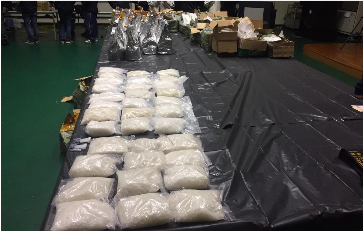
左下方為毒品甲基安非他命 34 公斤，左上方錫箔紙袋內裝有毒品鹽酸麻黃鹼 120 公斤，右上方紙箱內裝不明咖啡色粉末 276 公斤，疑為毒品先驅原料，已送刑事警察局鑑定中