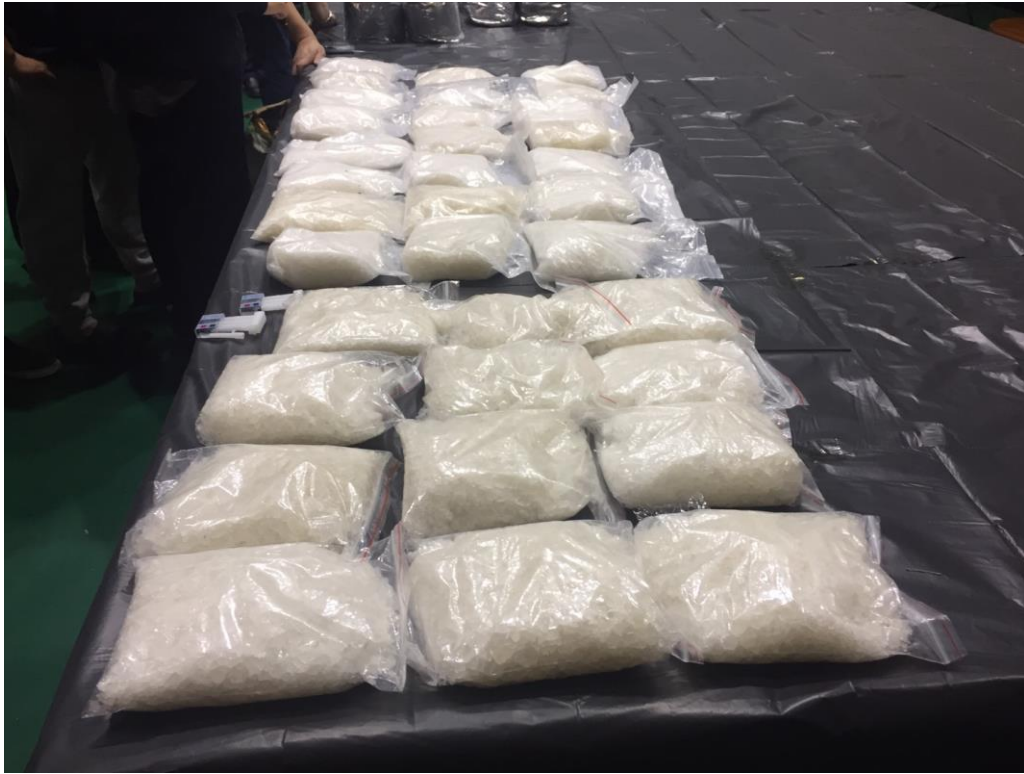
查獲毒品甲基安非他命 34 公斤