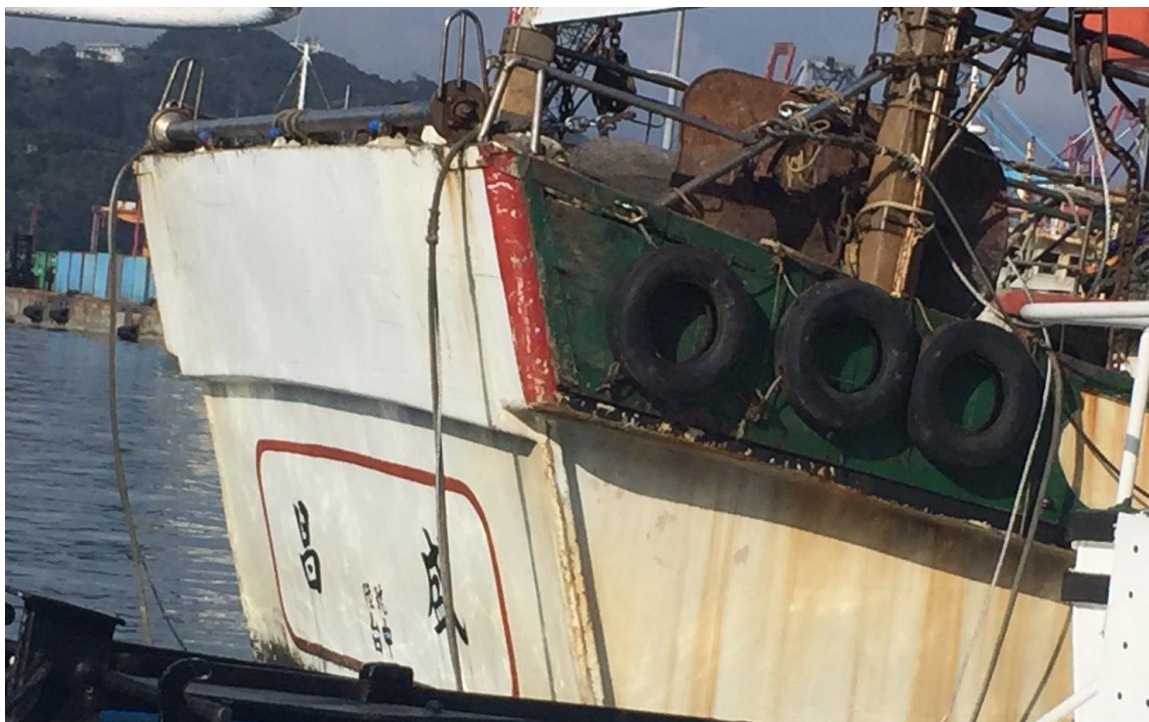
已查扣之「昌盛 6 號」漁船 (CT4-1230) 外觀