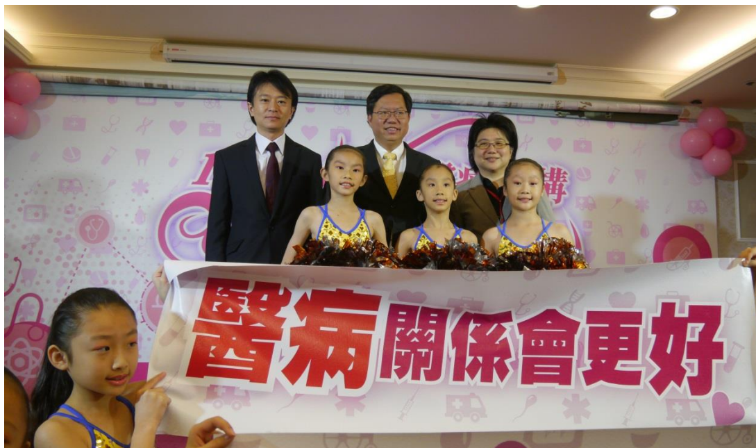
本署襄閱主任檢察官王以文與桃園市政府鄭文燦市長、桃園市政府衛生局局長蔡紫君與啦啦隊表演小朋友合影