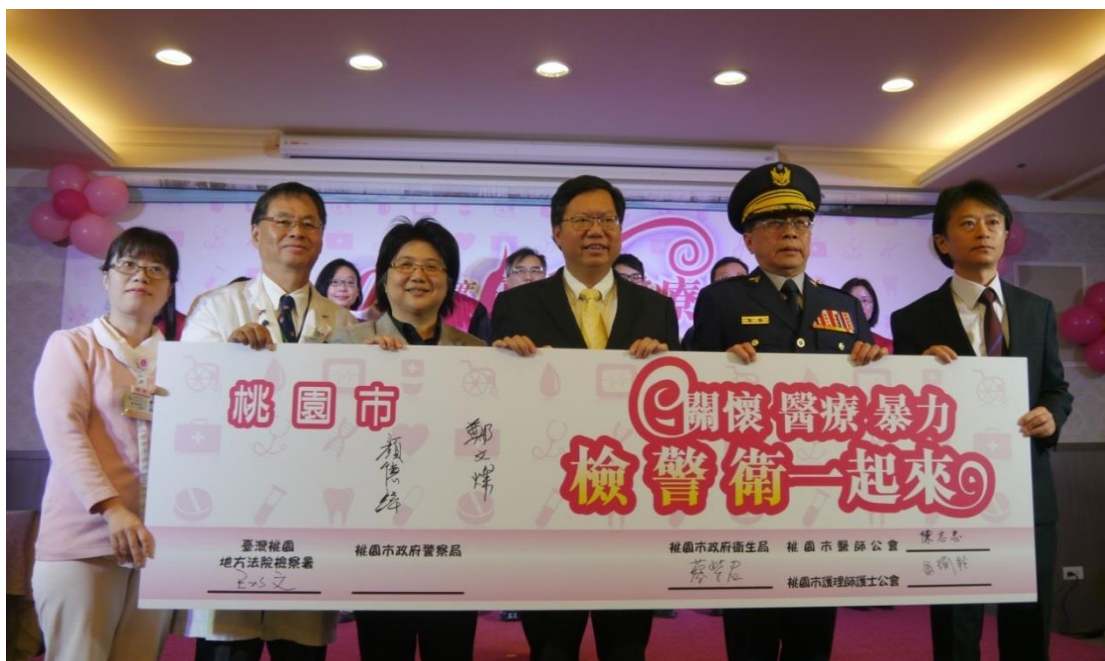
本署、桃園市政府、桃園市政府衛生局、桃園市政府警察局、桃園市醫師公會、桃園市護理師護士公會共同宣示關懷醫療暴力