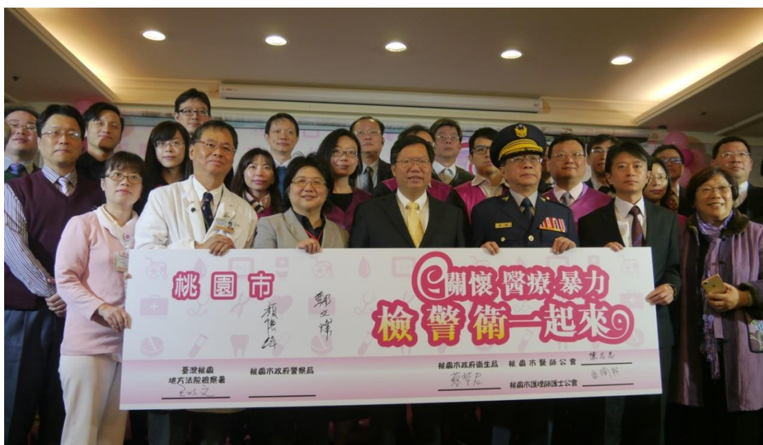
檢、警、衛三方共同打擊醫療暴力行為