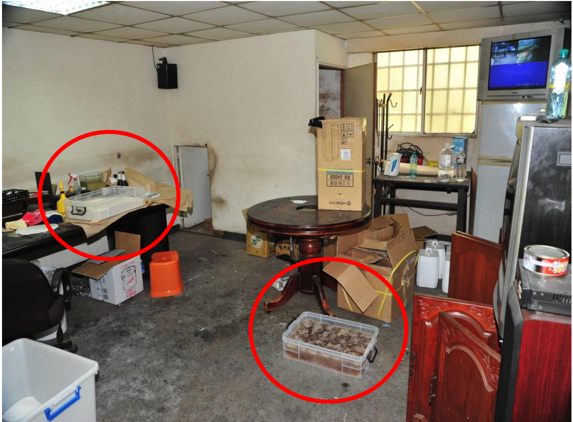
愷他命成品及半成品