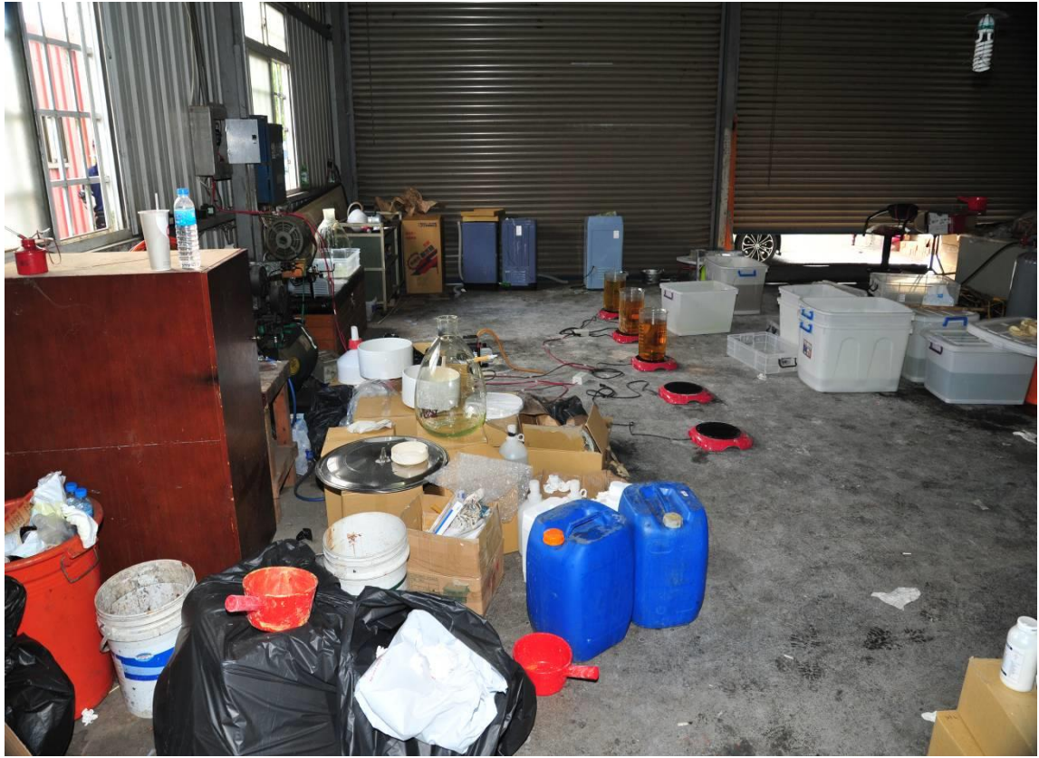
製毒工廠設備、原料