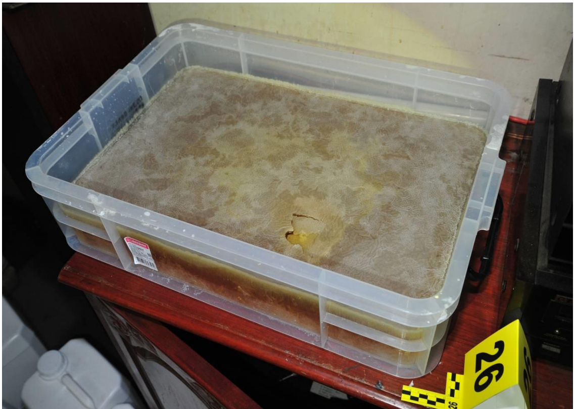
結晶中愷他命半成品