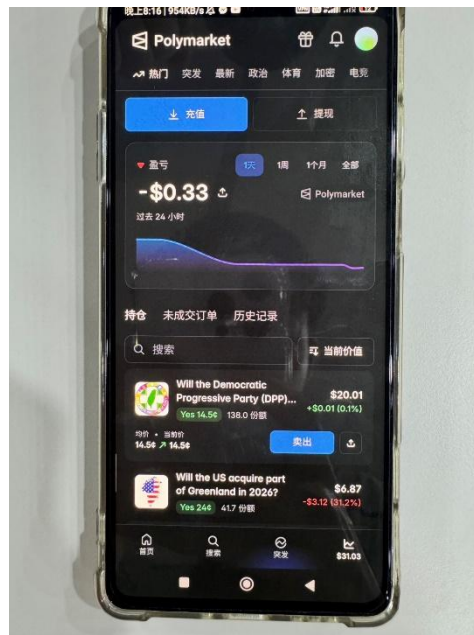
被告手機翻拍照片