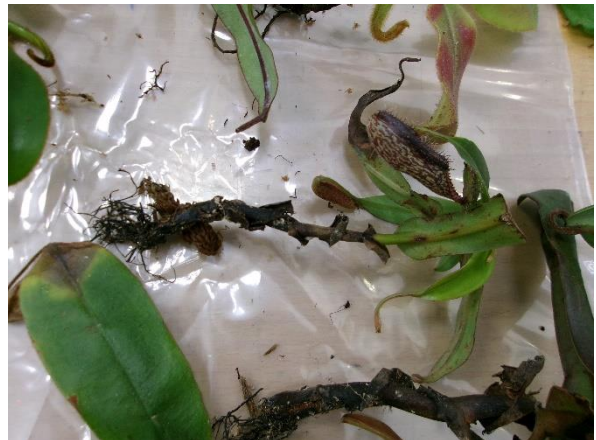
查獲豬籠草活植株