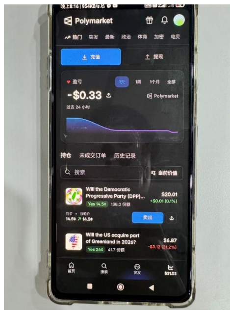
被告手機翻拍照片