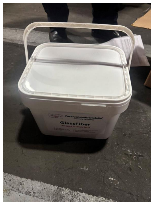
查扣貨物夾藏愷他命