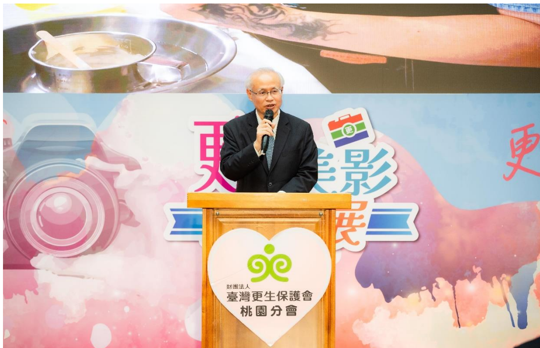
臺灣高等檢察署檢察長兼臺灣更生保護會張斗輝董事長致詞