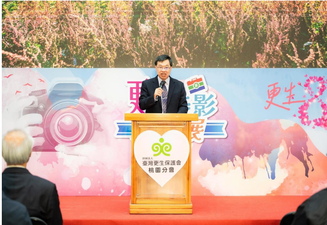
法務部徐錫祥政務次長致詞

本次展覽透過光影的心靈情感交流，重溫更生保護的溫厚底蘊，藉由攝影鏡頭，記錄更生保護的真實樣貌與社會復歸的溫暖力量，期盼藉此促進社會的包容與關愛，共同以柔性司法營造更溫暖的社會支持網絡，實現「以愛復歸」、「再犯防止」的使命和願景。