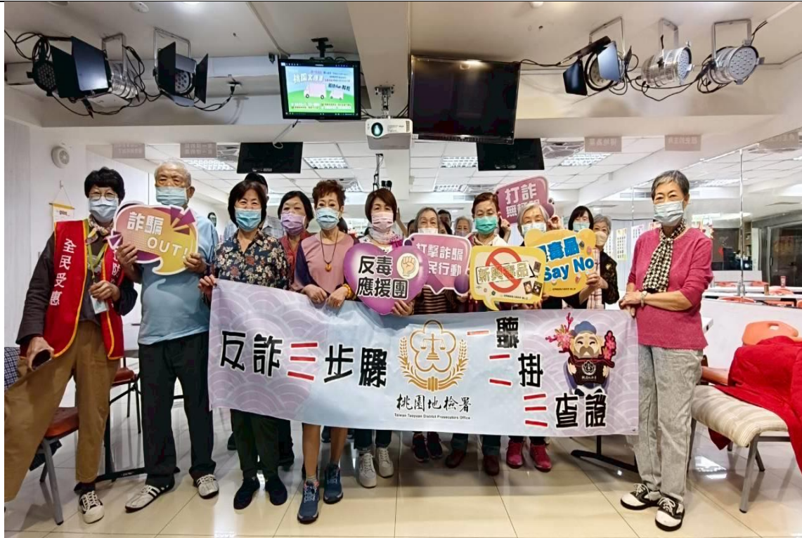
本署同仁和長者一起舉打詐活動布條