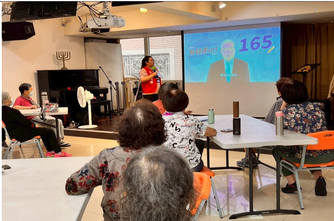
本署同仁以影片方式向長者宣導打詐反毒內容