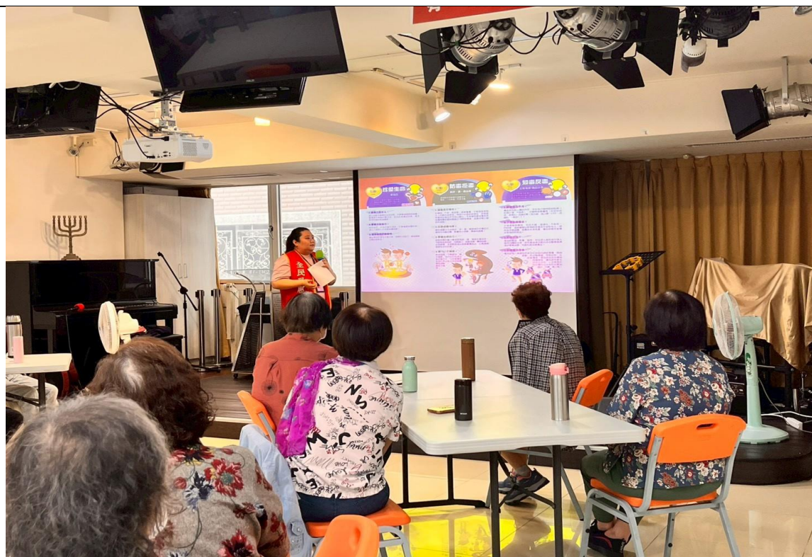
本署同仁向長者分享防詐步驟