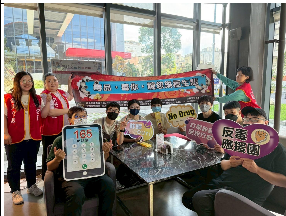
大家手舉布條及手舉牌，齊心反毒識詐，共創美好家園