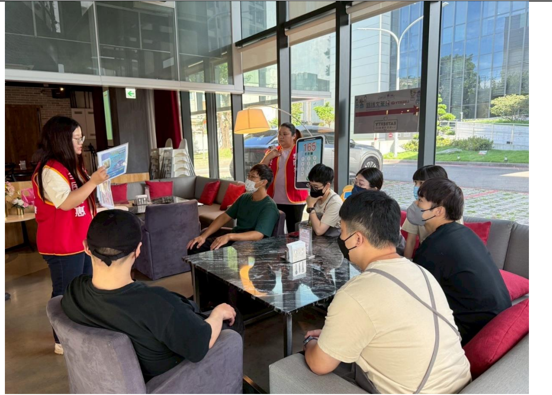
引導民眾辨識喪屍菸彈及新興毒品