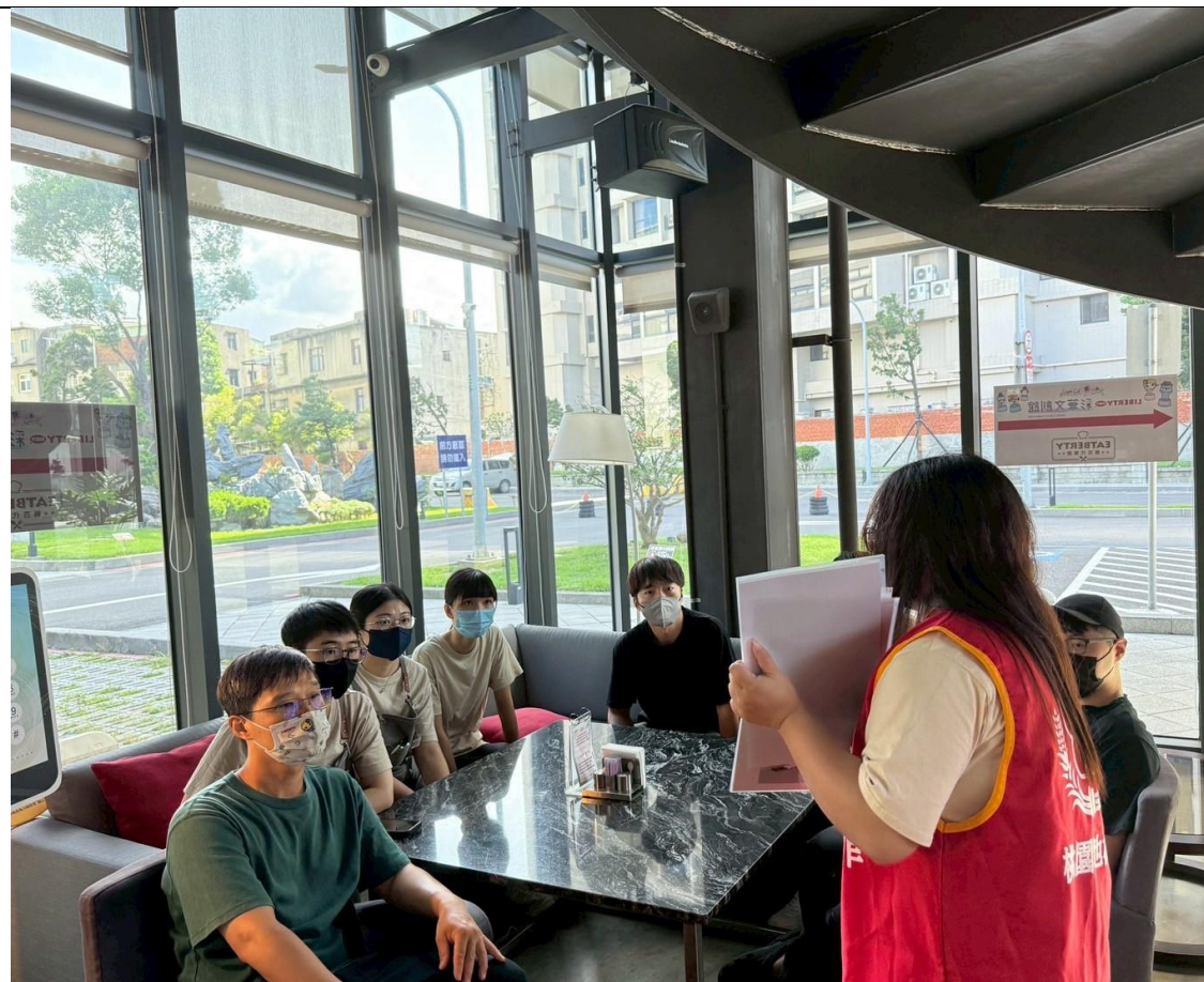
介紹網路購物詐騙手法讓民眾提高警覺心