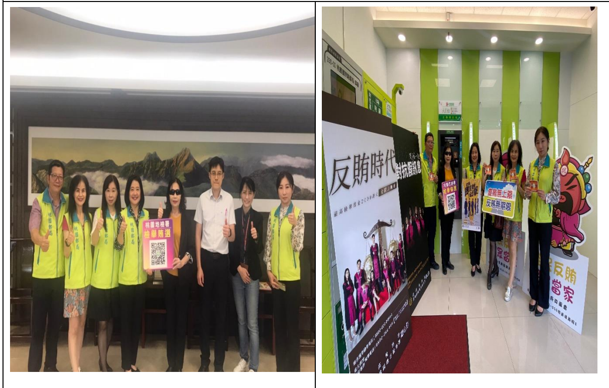
圖2、桃園地檢署檢察長俞秀端率隊邀桃園郵局局長康嘉芳、副局長連千惠、營管科科长古美媛、行銷科科长翁曉慧及政風室主任陳乾鎮加入【反賄時代】。