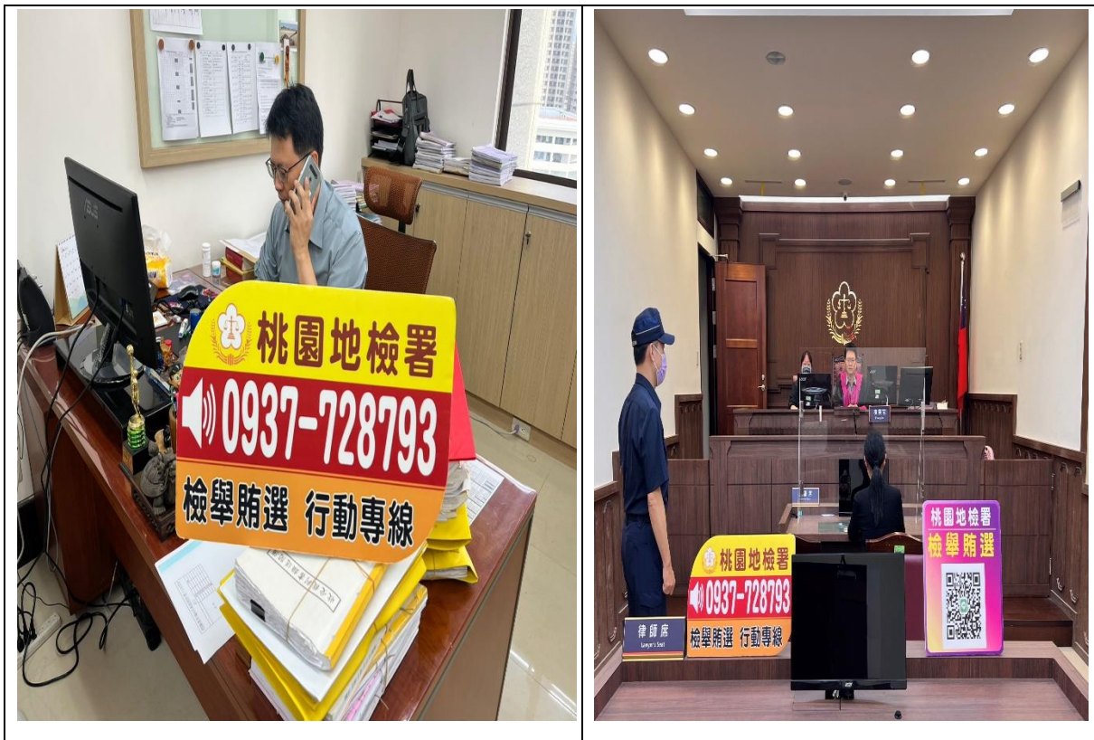
圖3、每通查賄專線均由檢察官親自接聽，過程完全保密。