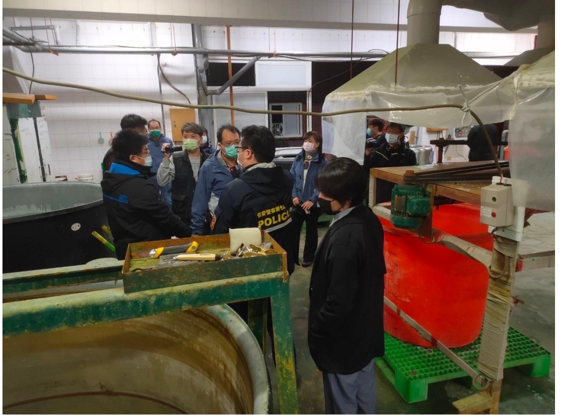
於搜索現場確認含鎳廢液非法處理方式