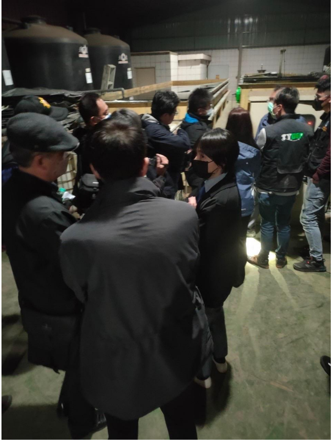
於搜索現場確認排放污水設備之運作時間及方式