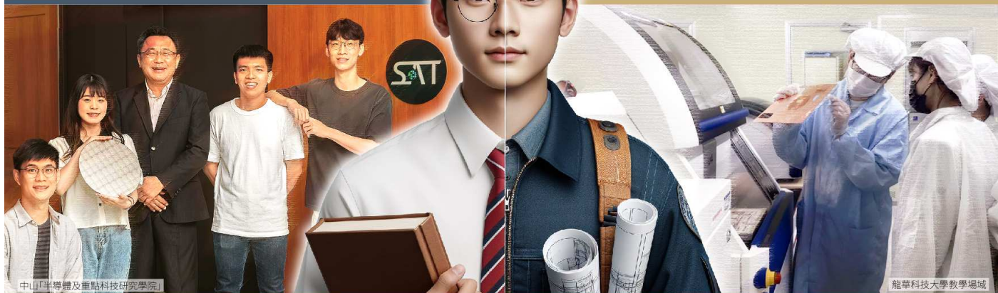
中山「半導體及重點科技研究學院」